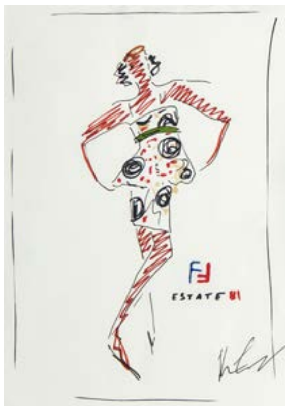
KARL LAGERFELD Dessin de mode au feutre Estimation 2 000 - 2 500 €