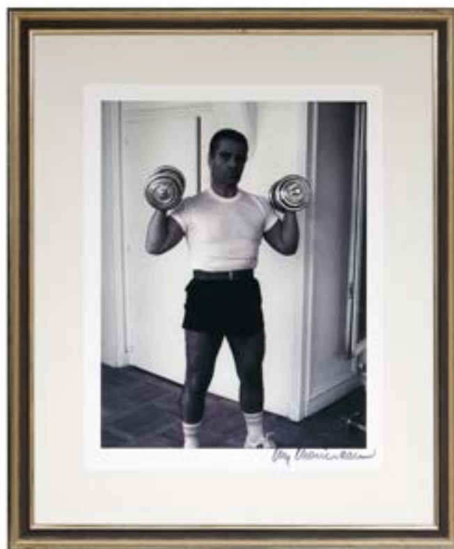
Karl Lagerfeld faisant de la gymnastique Paris, rue de Rivoli, 1983 Épreuve pigmentaire (c. 2010) Estimation : 100 - 150 €