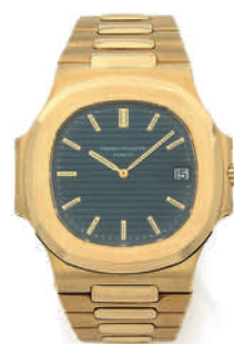
PATEK PHILIPPE Nautilus , ref. 3700, n° 1307047 Vers 1978 Montre bracelet en or jaune 18k (750) Estimation : 80 000 - 120 000 €

Une belle sélection de pièces sportives signées Rolex, parmi lesquelles une superbe Oyster Perpetual Date « Fair Play Cup ». Ce rare modèle en acier fut offert à l'organisateur des épreuves de hockey sur glace des Jeux Olympiques de 1968. Estimé entre 10.000 et 15.000€, cette montre atypique séduira les amateurs de vintage. Du côté des montres professionnelles, les adeptes de la Comex pourront retrouver une pièce des années 1990 provenant directement de son propriétaire d'origine, devenu plongeur-démineur au sein du GISMER (Groupe d'Intervention Sous la Mer) à l'issue de sa carrière chez Comex (est. 60 000- 80 000 €).