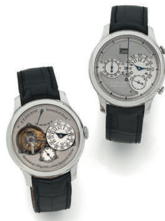
F.P. JOURNE Octa chronographe Ruthenium vers 2006 Ed. limitée à 99 ex Estimation : 150 000 - 250 000 €

Une montre Rolex Fairplay Cup fut offerte à chaque joueur de l'équipe de Hockey sur glace qui remporta le titre de Champion Olympique et Champion du monde, ainsi qu'à certains membres de l'équipe organisatrice des Jeux Olympiques. Cette montre est l'un des rares exemplaires offerts à un français.