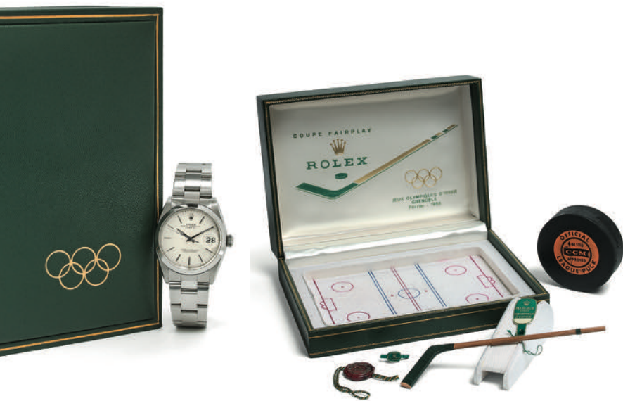
ROLEX « Rolex Fairplay Cup, World Ice Hockey Championship Grenoble 1968 » Oyster Perpetual Date , ref. 1500 Vers 1967 Estimation: 10 000 - 15 000€

Cette montre fut offerte en 1968 à l'organisateur des épreuves de Hockey sur glace des Jeux Olympiques d'hiver qui se déroulèrent en 1968 à Grenoble. Elle fut depuis conservée par la famille de son seul et unique propriétaire et sera présentée pour la toute première fois en vente publique.