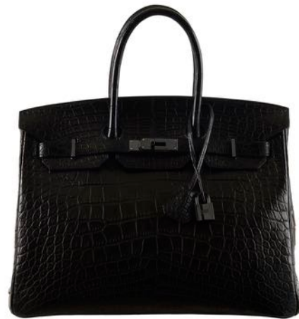
HERMÈS Sac BIRKIN SO BLACK 35, 2010. Édition limitée En alligator mat noir. Estimation : 50 000 - 70 000 €