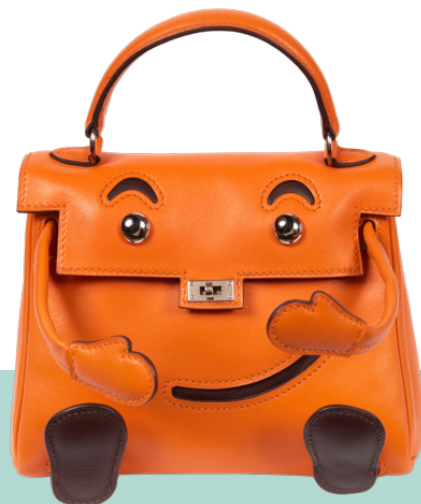
HERMÈS Sac QUELLE IDOLE, 2000. Édition limitée En veau Gulliver orange et marron. Estimation : 12 000 - 22 000 €