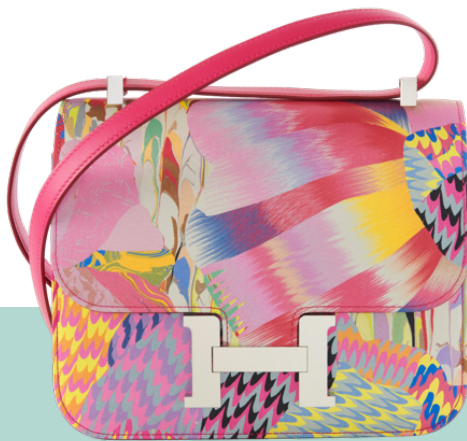
HERMÈS Sac CONSTANCE III MARBLE SILK 24, 2021. Édition limitée En veau Swift Rose Mexico et soie Marble Silk. Estimation : 10 000 - 15 000 €