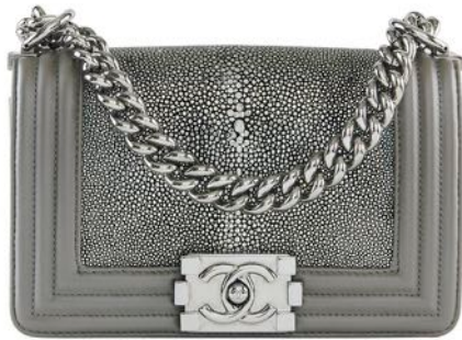
CHANEL Sac BOY En galuchat gris et taupe. Estimation : 5 000 - 7 000 €

Cette session hivernale offrira également des éditions limitées aux couleurs vives, telles qu'un Constance Marble Silk (10 000/15 000 €) et un Quelle Idole orange (12 000/17 000 €).