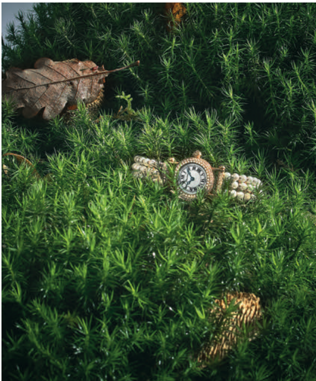
CARTIER Diabolo , ref. 1471, vers 1997 Montre bracelet de dame en or jaune, perles et diamants Estimation : 8 000 - 12 000 €