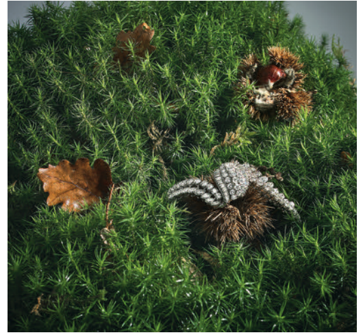
VACHERON CONSTANTIN Joaillerie, ref. 6612, vers 1960 Montre bracelet à secret en or blanc, platine et diamants Estimation : 20 000 - 30 000 €

Des pièces cultes comme l'Ellipse , la Panthère ou des modèles plus rares comme une étonnante Mystérieuse signée Jaeger LeCoultre (est. 800 – 1 200 €) seront également présentées aux enchères.