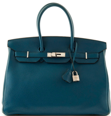
HERMÈS, 2014 Sac BIRKIN 35 Taurillon Clémence Bleu Cobalt Estimation : 6 000 - 8 000 €