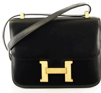
HERMÈS, 2003 Sac CONSTANCE 24 Box noir Estimation : 4 000 - 6 000 €