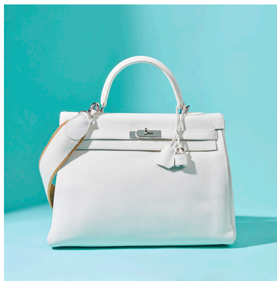
HERMÈS, 2014 Sac KELLY Retourné 35 Taurillon Clémence blanc Estimation : 4 000 - 6 000 €