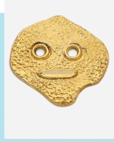
PIERRE HUGO pour Max ERNST Sculpture pendentif " Grande Tête" or 23K Adjudgé 59 800 € frais inclus