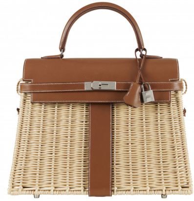
HERMÈS Edition Limitée Sac Kelly Picnic 35 Adjugé 39 700 € frais inclus