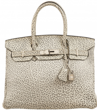
HERMÈS Sac Birkin 30 Garniture métal argenté palladié Adjugé 44 900 € frais inclus