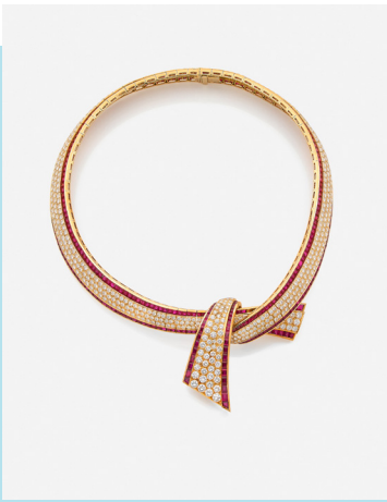
VAN CLEEF & ARPELS Collier ruban noué or, diamants et rubis, circa 1990 Adjudgé 104 000 € frais inclus