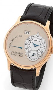
F.P. Journe Octa Reserve de marche Adjugé 143 000 € frais inclus