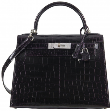
HERMÈS Sac Kelly Sellier 28 Crocodile du Nil Prunoir Adjugé 49 400 € frais inclus