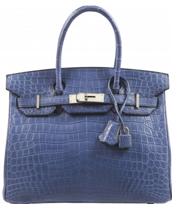
Hermès 2007 sac Birkin Adjugé 33 800 € frais inclus